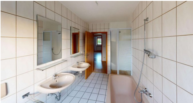
Tageslichtbad mit Wanne und Dusche