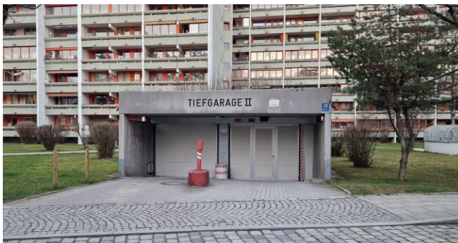
Ein- und Ausfahrt