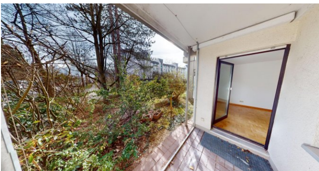
Terrasse mit Gartenanteil