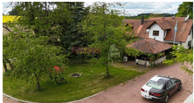
Feuerstelle und Freisitz