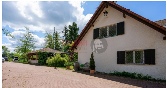
Altbau mit Freisitz