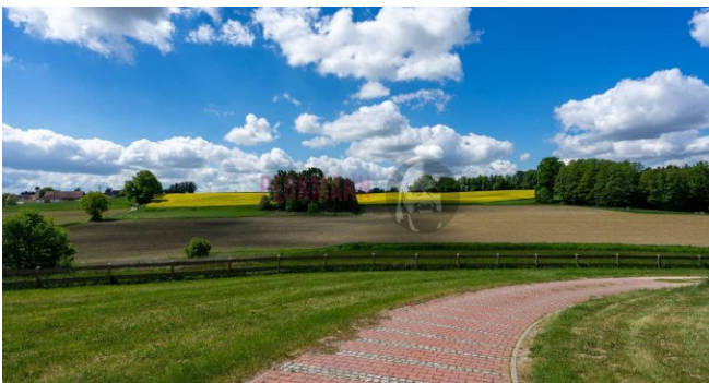
Blick von der Einfahrt aus