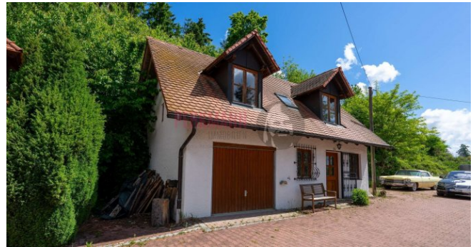
Garage mit Werkstatt