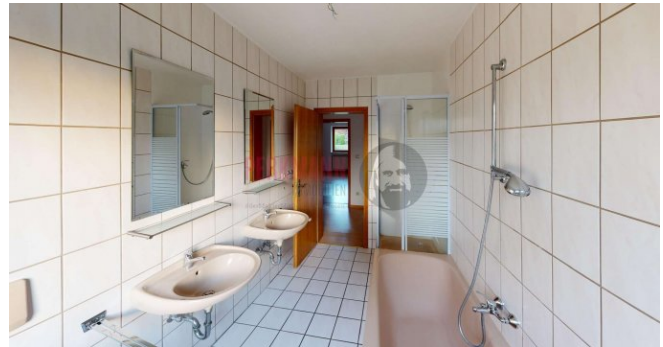
Tageslichtbad mit Wanne und Dusche