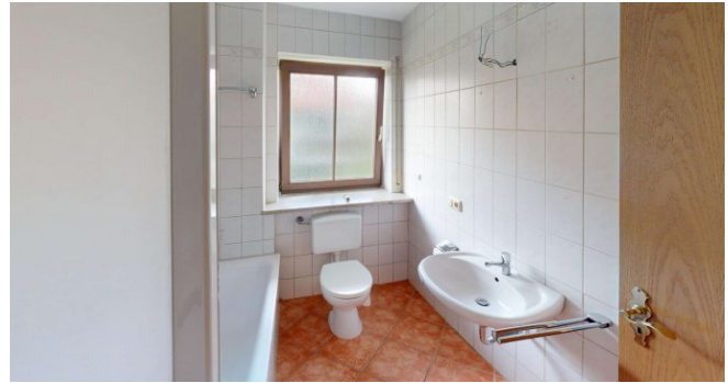
Tageslichtbad mit Badewanne