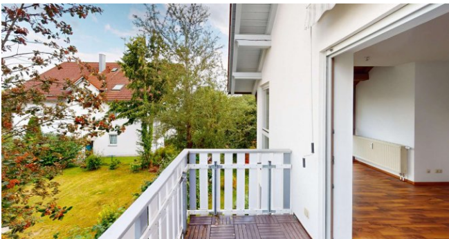
Balkon mit Ost-Ausrichtung