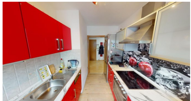
Einbauküche (Eigentum vom Mieter)