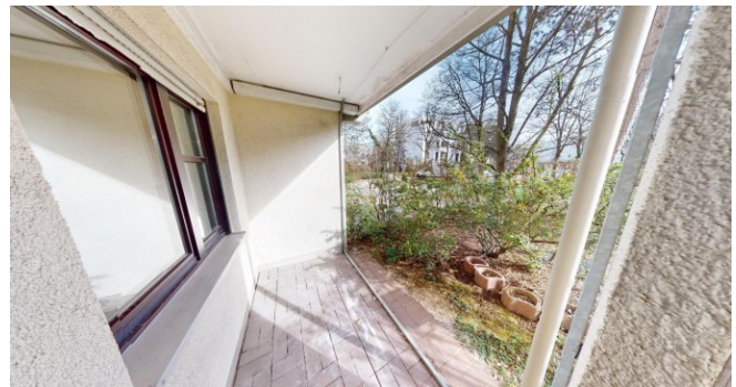
Terrasse mit Gartenanteil