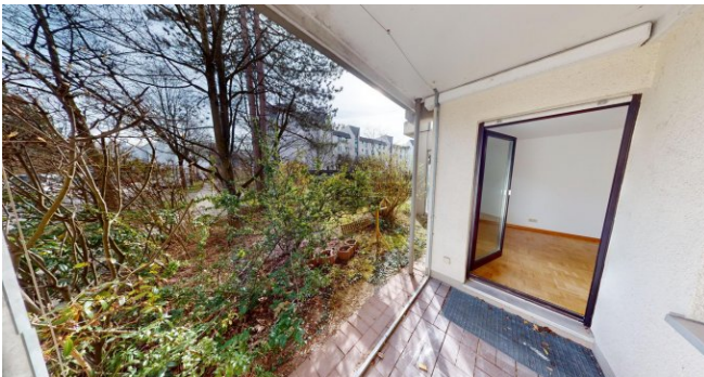
Terrasse mit Gartenanteil