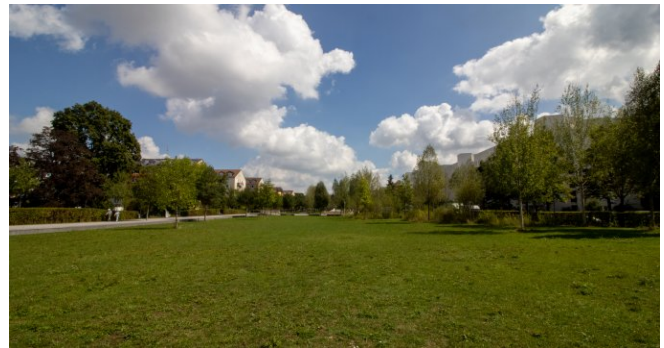
Parkanlage vor der Haustüre