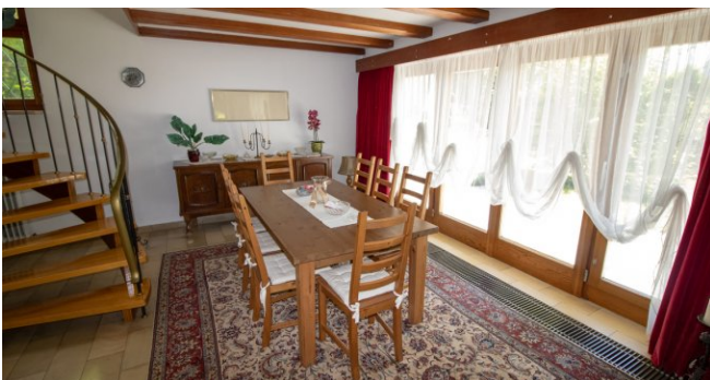
Essbereich im UG