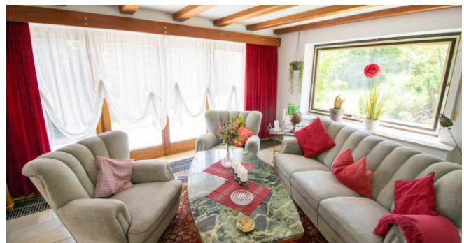
Wohnbereich im UG