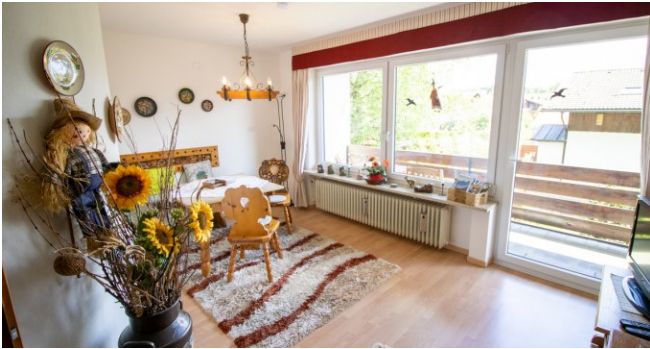
Stube im EG