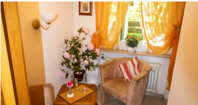
Leseraum im EG