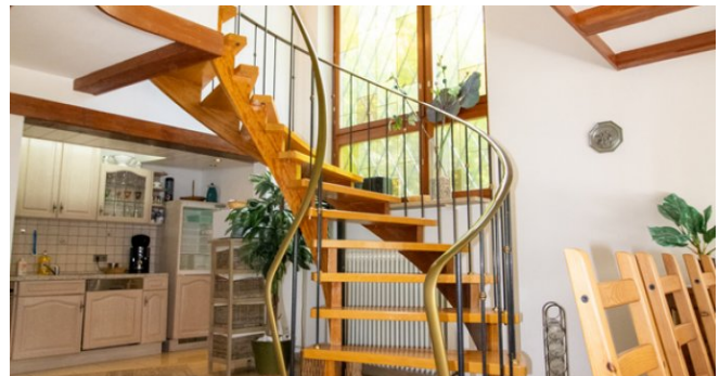
Treppe ins EG