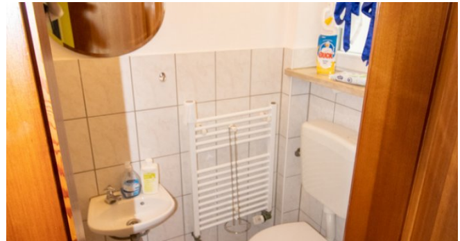
Gäste WC im EG