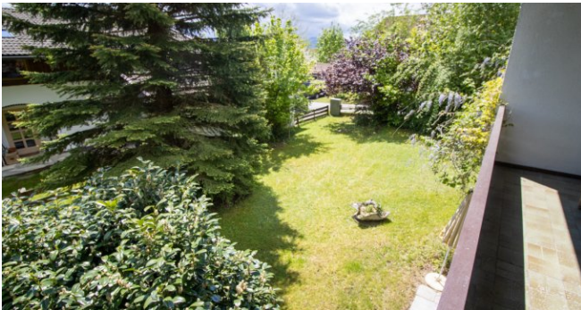
Blick in den Garten