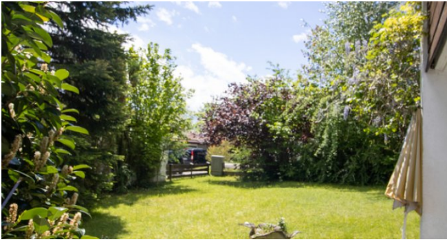
Blick von der Terrasse